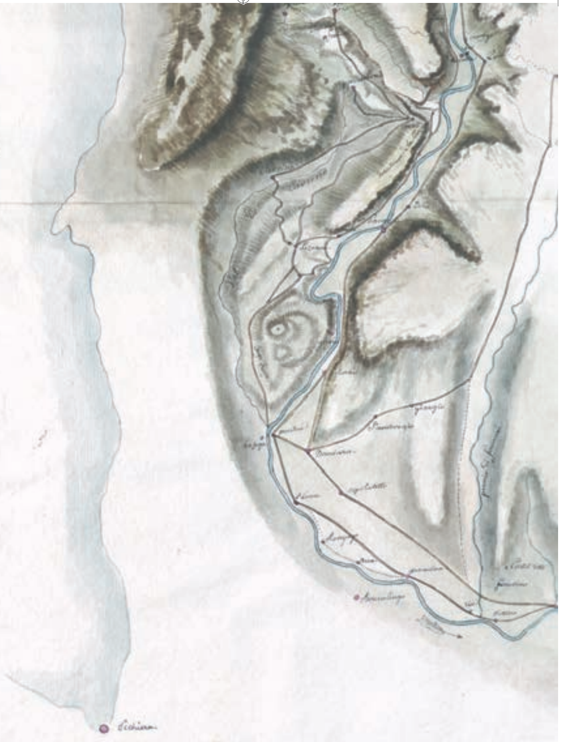
Carte, de la Vallée de l'Adige, depuis Botzen jusqu'à Vérone, 65x140 cm, Atlas des cartes et plans concernant la campagne de l'Armée des Grisons commandée par le Général en Chef MacDonald, en l'An IX Carte générale du Tyrol, 1810, Fondazione Museo storico del Trentino, Archivio iconografico, Cassettiera A